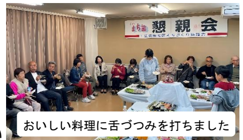
おいしい料理に舌づつみを打ちました

2025年11月1日（土）、千里新田地区公民館にて、夏祭りと市民体育祭の慰労と親睦を兼ねた懇親会を開催しました。今年は、小・中学生4名を含む47名にご参加いただき、終始、和やかな笑い声が会場に響きました。お料理は毎年趣向を凝らして献立を選んでおり、今回は彩り豊かなカップサラダを新たに取り入れたところ「きれい！」「おいしい！」と大好評でした。また、初の試みとして夏祭りと体育祭の写真をスライドショーで上映。子どもたちの笑顔やスタッフの生き生きとした姿に会場は思い出話で盛り上がり、笑顔あふれるひとときとなりました。最後は、「今後も皆で力を合わせて地域活動を楽しく続けていこう」との思いを込め、威勢の良い大阪締めで、晴れやかに開きとなりました。