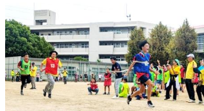
大逆転のブロック対抗リレー

今後も、地域の皆様と千里新田地区が盛り上がる市民体育祭を開催しますので、ご協力よろしくお願いいたします。