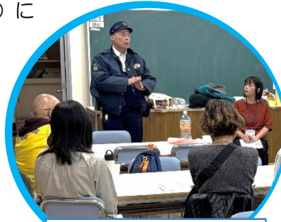
お巡りさんのお話

千里山西6丁目のつみき遊園・千里山竹園2丁目の南千里くさ笛遊園・春日3丁目の春日会館の3ヶ所を集合場所としてそれぞれのコースへ出発。危険箇所や看板の設置状況等を確認しながら小学校に集まっていたいただき、各コースの報告会を行いました。今回は千里山交番のお巡りさんに来ていただき、最後にお話を伺うことができました。