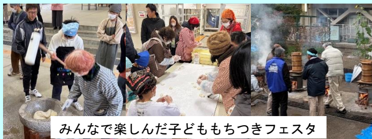
みんなで楽しんだ子どももちつきフェスタ

当日は、50kgのもち米を準備し、早朝7時からの湯沸かしからはじまり、その後、順次集まったスタッフの皆さんがそれぞれの持ち場について「もちつき」がスタートしました。今回は児童や生徒のみなさんも一緒になってもちつきを手伝ってくれたことで盛大な「もちつきフェスタ」となり、無事13時30分過ぎには終了となりました。