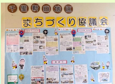
まちづくり協議会のPR

来年もさらに楽しく笑顔あふれる千里新田地区公民館の文化祭を企画いたしますので皆さまご支援ご協力の程宜しくお願い申し上げます。